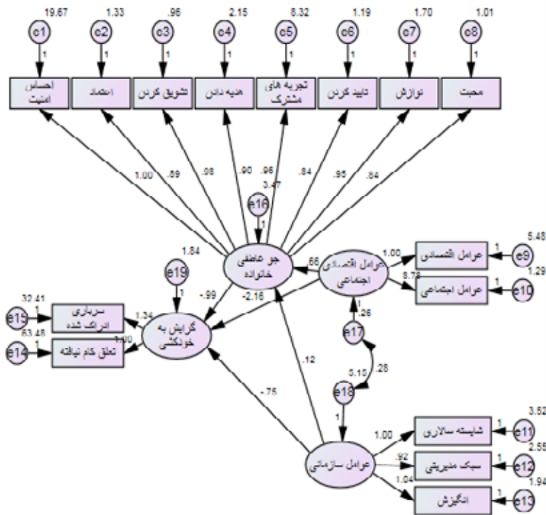
مجله روان‌پزشکی و روان‌شناسی بالینی ایران