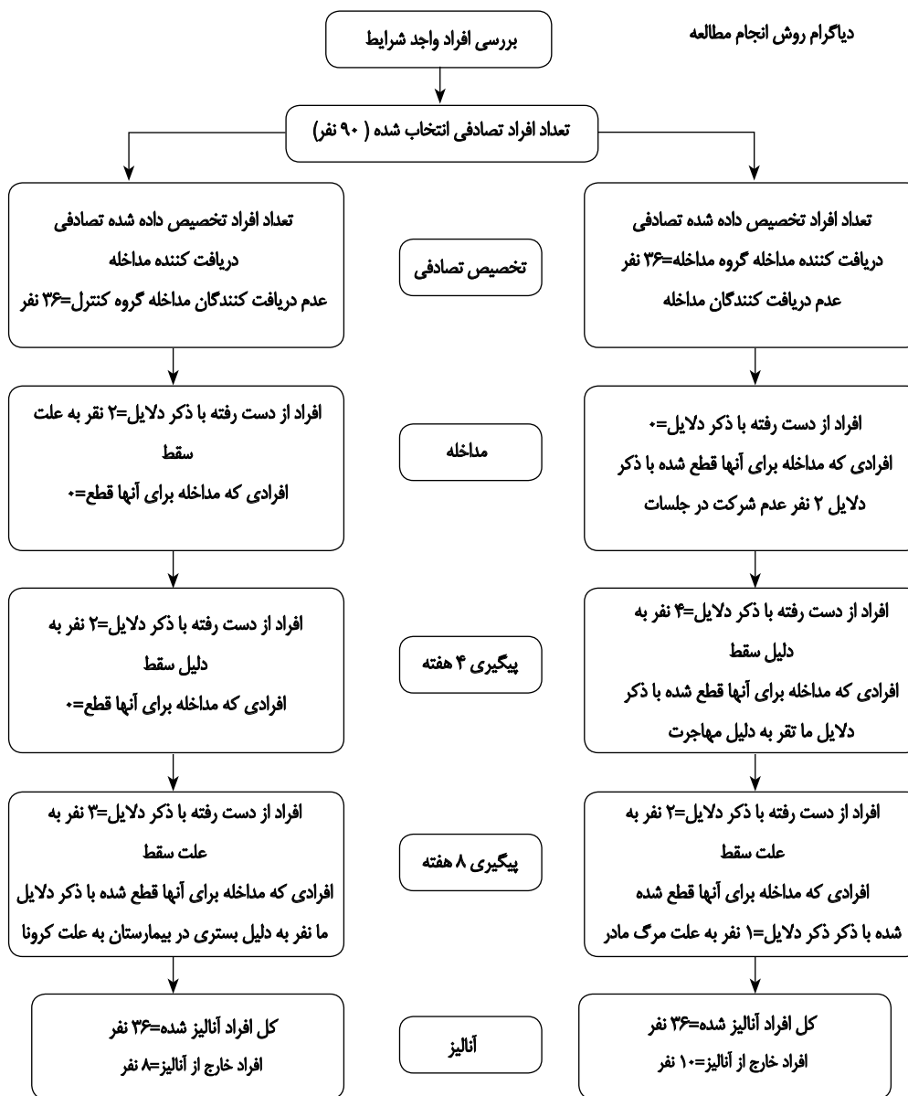
تصویر ۱، دیگرام کنسورت

مجله روان‌پزشکی و روان‌شناسی بالینی ایران