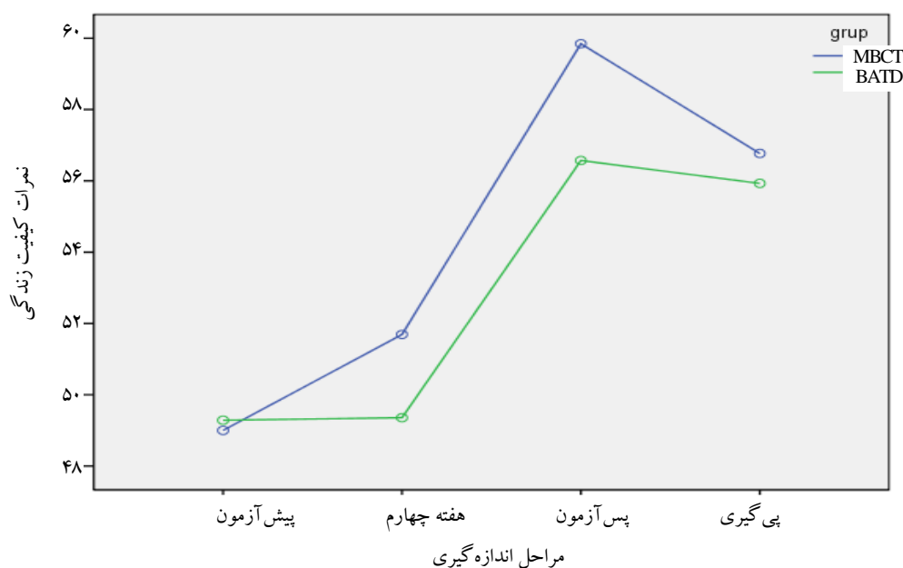
شکل ۲- میانگین نمرات کیفیت زندگی دو گروه طی چهار مرحله اندازه‌گیری

گروهی ( p < 0/05 و F = 0/605 ) معنادار نیستند. در واقع بین نمرات دو گروه در افکار خودکشی تفاوت معنی‌داری بوجود نیامده و نشان می‌دهد هم درمان شناختی مبتنی بر حضور ذهن و هم درمان فعال‌سازی رفتاری در کاهش پایدار و معنادار نمرات افکار خودکشی اثربخشی یکسانی داشته‌اند (جدول ۳).