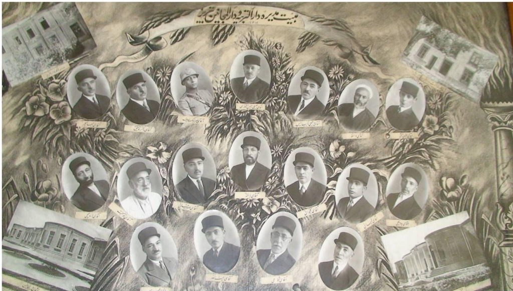
شکل ۲- هیئت مدیره دارالتربیه و دارالمجانین تبریز