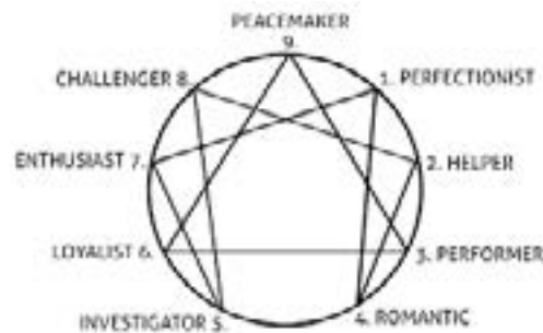
Figure 1. The enneagram of personality types

in Iran is the nine-personality types known as “enneagram”. It is a system consisting of nine personality types that addresses the strengths and weakness of each type and provides a global language that helps people better understand themselves and others. The enneagram diagram consists of a triangle and a hexagon enclosed within a circle. The combination of these elements creates nine points along the circle. Each of these nine points provides a strategy for interacting with the environment which affects personality and identifies nine distinct personality types (Figure 1).