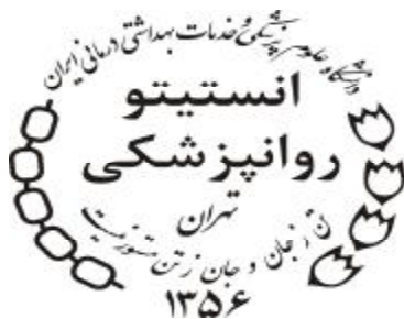
تصویر 4- نشان‌واره انستیتو روانپزشکی تهران

به پاس تلاش‌های دکتر ایرج سیاسی و همکارانشان در انجمن توانبخشی، سال 1356 (سال آغاز به کار واحدهای آموزشی و پژوهشی انجمن) نقش بست. آرم یا نشان‌واره انستیتو توسط دکتر محیط طراحی شده است. نمادهای به کار رفته در این نشان‌واره، حال و هوای فضای انقلابی آن سال‌ها را تداعی می‌کند؛ زنجیرها از یک سو به زنجیر استبداد و از سوی دیگر به زنجیر بسته شده به پای بیماران مبتلا به اختلالات روانپزشکی اشاره دارد و لاله‌ها نیز در دو معنا به کار گرفته شده‌اند؛ یکی نمادی از خون شهیدان وطن و دیگری لاله‌ای که باید به جای زنجیر، به پای بیماران روانپزشکی بسته شود و همه این‌ها با مصرعی از شاعر پرآوازه و اندیشمند ایرانی، مولوی مزین می‌شود: «تن ز جان و جان ز تن مستور نیست».