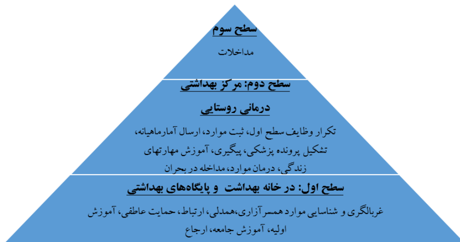
شکل ۲- خلاصه مدل پیشگیری از همسرآزاری در مدل مراقبت‌های بهداشتی اولیه ایران و ادغام بهداشت روان

برای ارائه طرح خدمات پیشگیری از همسرآزاری در نظام خدمات بهداشتی ایران، مدلی مبتنی بر این نظام و نظام ادغام یافته بهداشت روان در مراقبت‌های بهداشتی اولیه (۷۴) - که تاریخچه و توسعه آن شرح داده شد- به شرح زیر و با رعایت ویژگی‌های نظام مراقبت‌های بهداشتی اولیه در ایران طراحی شد. ویژگی‌های مدل «پیشگیری از همسرآزاری در مراقبت‌های بهداشتی اولیه» (شکل ۲)، همان ویژگی‌های نظام مراقبت‌های بهداشتی و بهداشت روانی ایران است که عبارتند از: سطح‌بندی خدمات؛ غربالگری و شناسایی موارد همسرآزاری؛ پاسخ‌گویی به نیازهای اولیه بهداشتی، بهداشت روانی و مراقبت از قربانیان همسرآزاری؛ ارجاع موارد به سطوح بالاتر در صورت نیاز به خدمات تخصصی‌تر؛ بازخورد از سطوح بالاتر؛ جامعیت خدمات (که خود شامل پیشگیری