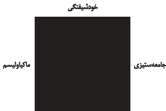
مجله روان‌پزشکی و روان‌شناسی بالین ایران