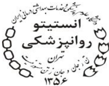
تصویر 4- نشان‌واره انستیتو روانپزشکی تهران